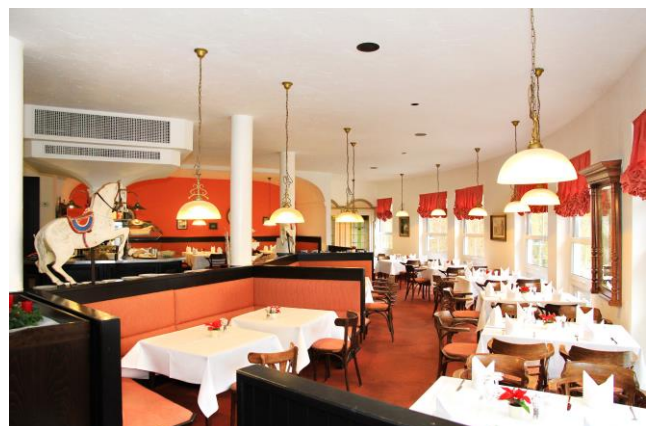
Das Restaurant Beisl