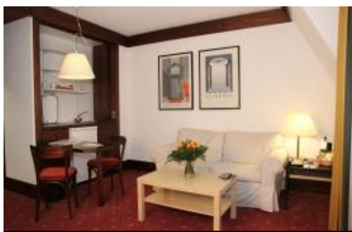
Superior – Appartement