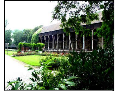
Kurpark Bad Salzdetfurth

EUR 57,00 p. P. im DZ; EUR 15,00 EZ-Zuschlag